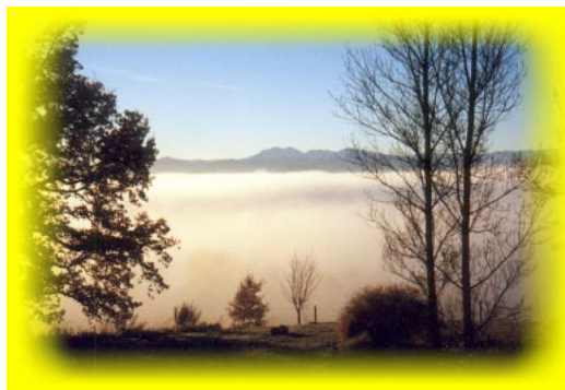
Un matin à Providence

Conditions idéales pour des groupes allant jusqu'à 12 personnes